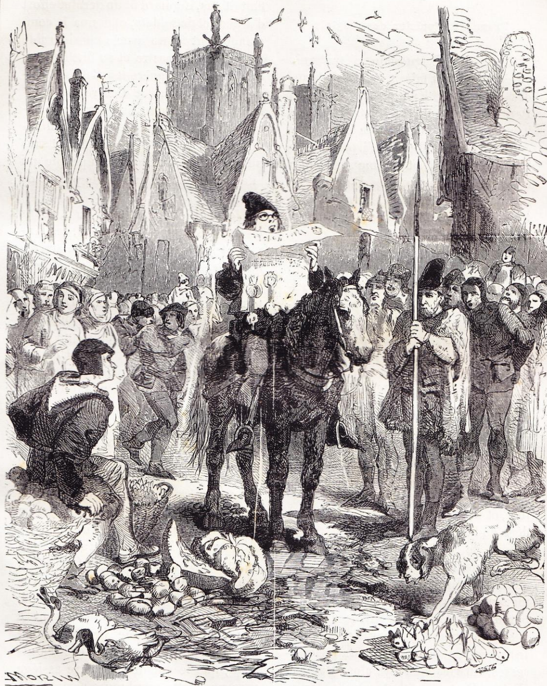
LA LOI AU MOYEN AGE. — Annonce d'un nouvel impôt.

et à sang; la ville rendue, il fit même décapiter 3 000 personnes.