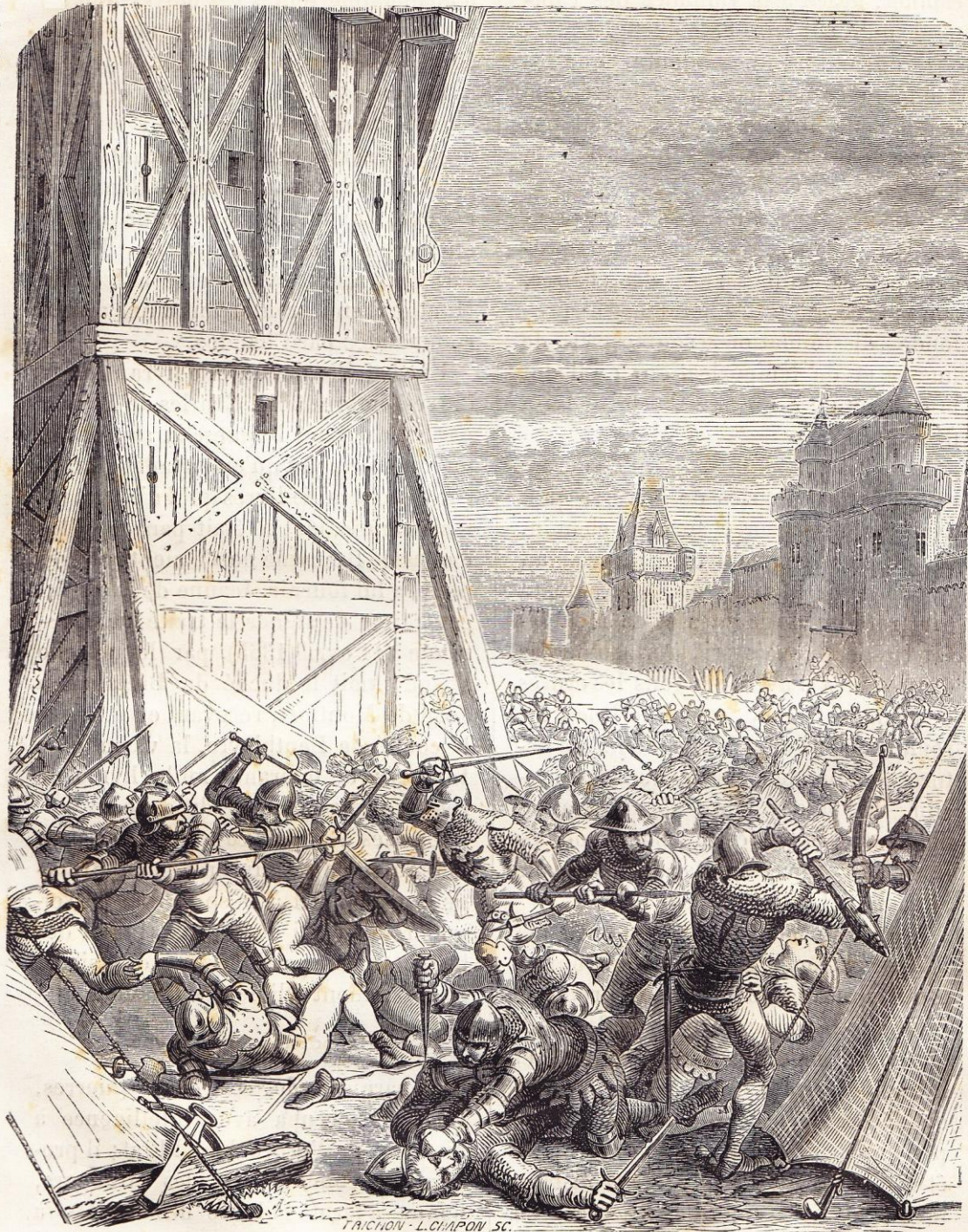
LES EXPLOITS DE DUGUESCLIN. — Duguesclin incendie une machine au siège de Rennes (1356).

par sa faiblesse corporelle, retenu dans ses châteaux par son état maladif, nul prince pourtant ne fit plus la guerre